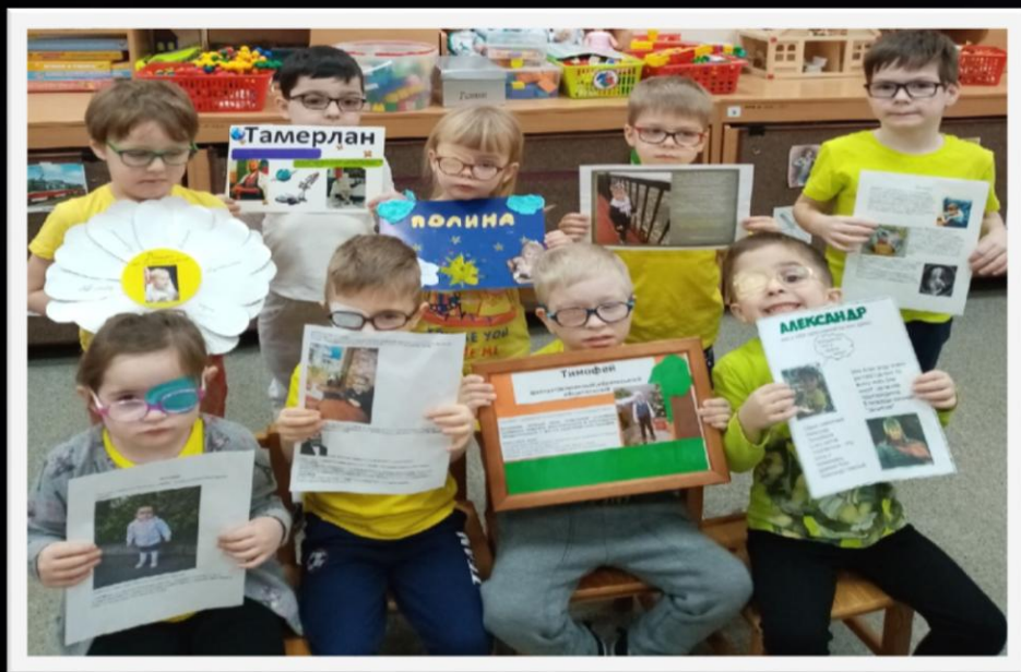
Выставка детских работ

Несколько имен мальчиков также несут в себе отблеск святости. Старинные русские корни этих имен стали для нас настоящим открытием и вдохновили на создание проекта "Богатыри Земли Русской".